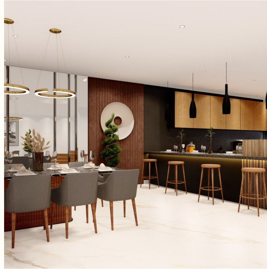
Piso de mármol (2 tipos)