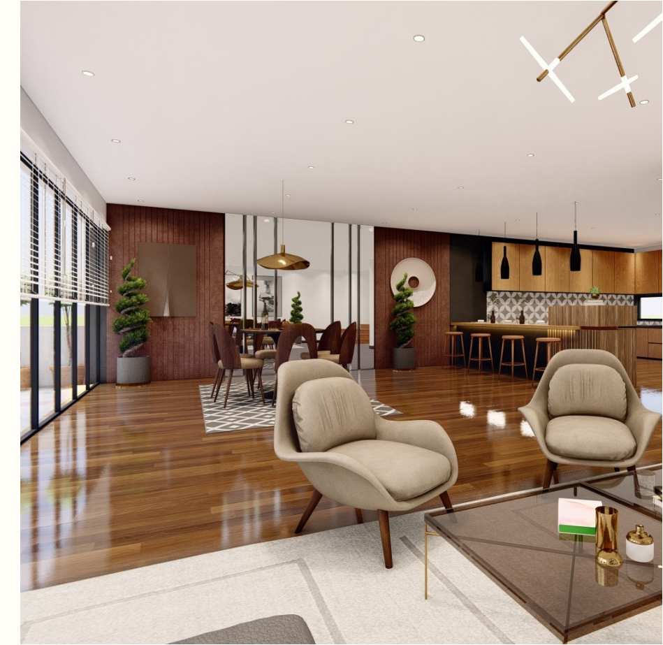
Madera de Ingeniería (5 Colores)