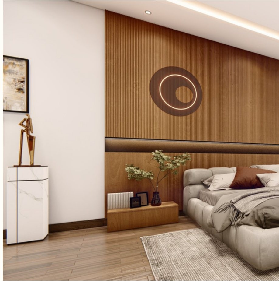
Piso Compuesto de piedra y Vinil (8 colores)