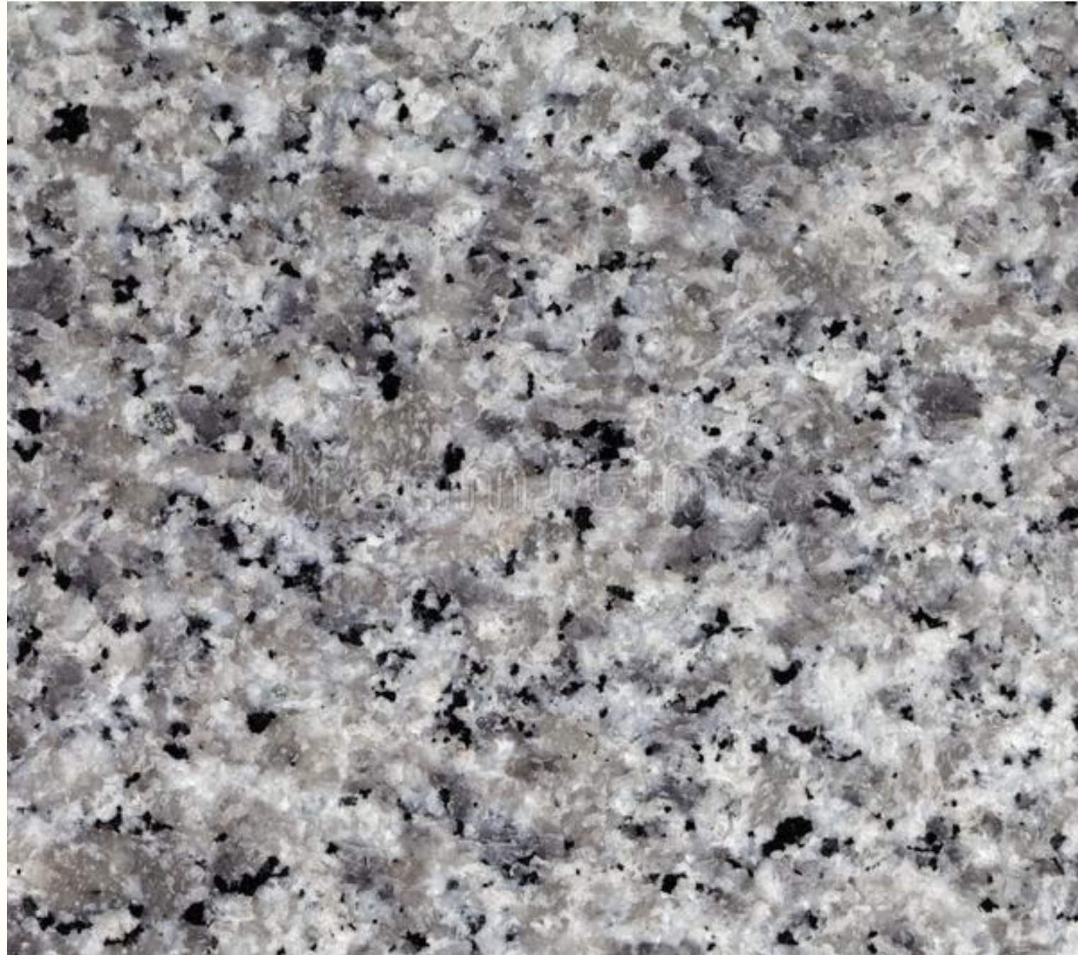
Granito Gris Sardo